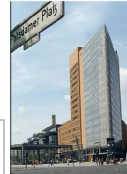
Standort Berlin Potsdamer Platz 11 10785 Berlin