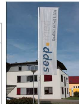
sepp.med Headquarter Gewerbering 9 91341 Röttenbach