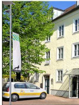
Standort Wolfsburg Goethestraße 55 38440 Wolfsburg