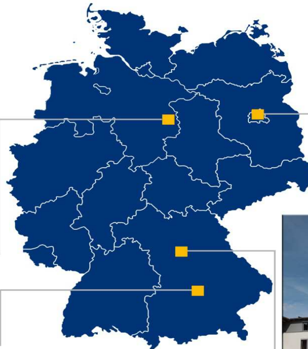
Standort Ingolstadt Richard-Wagner-Str. 39 85057 Ingolstadt